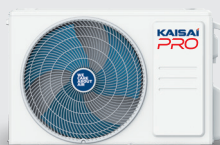
Външно тяло KRP